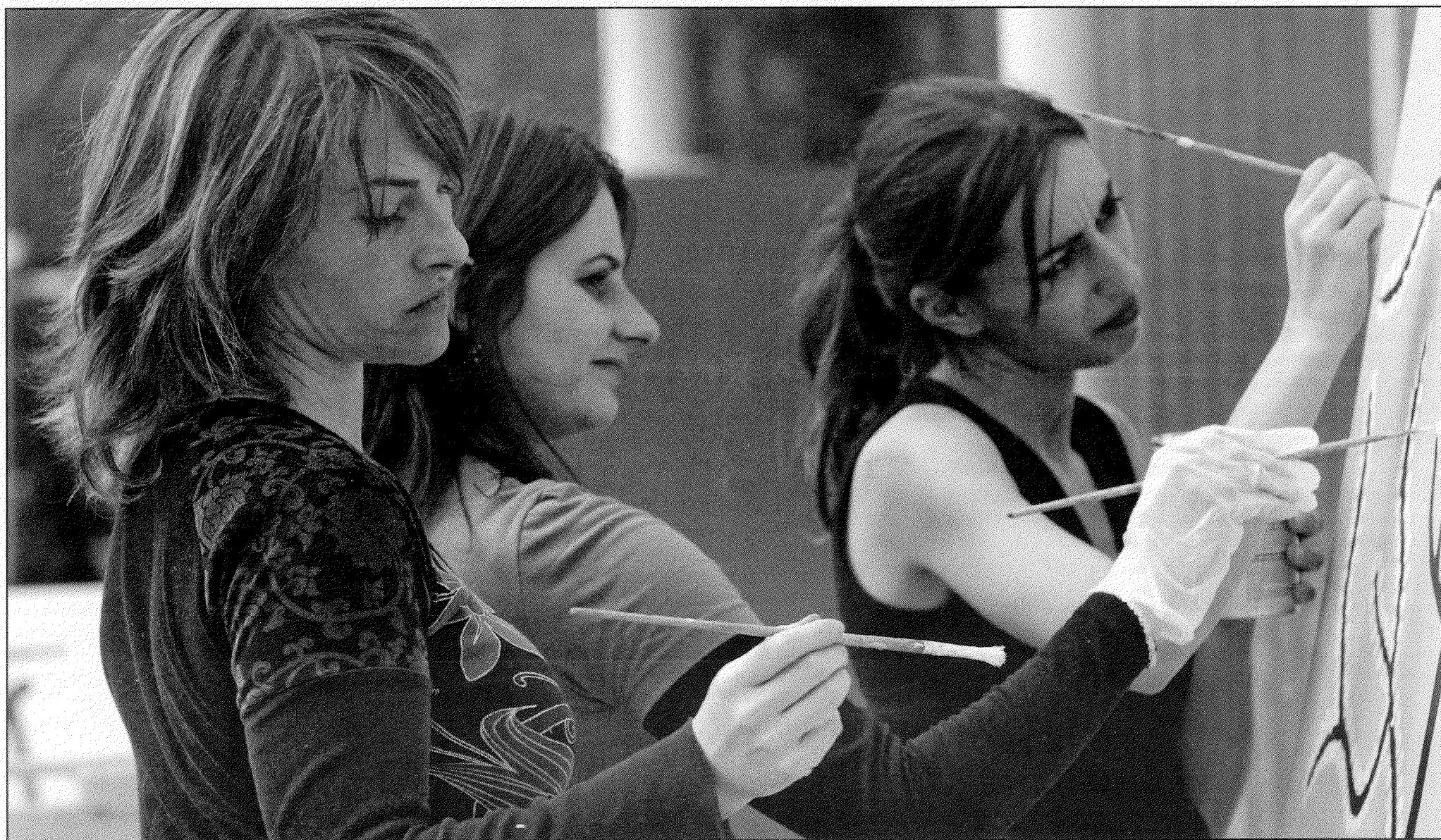
'Feestgangers' aan het werk bij De Compaan in Den Haag, een instelling die verstandelijk gehandicapten ondersteunt.

De combinatie 'leuk en nuttig' bleek een schot in de roos. De jonge directeur kon al snel gaan uitbreiden. Het ruime grachtenpand hangt vol met kleurrijke foto's van georganiseerde bedrijfsuitjes. Vaak worden tijdens die uitjes de handen flink uit de mouwen gestoken. Hoe krijg je werknemers