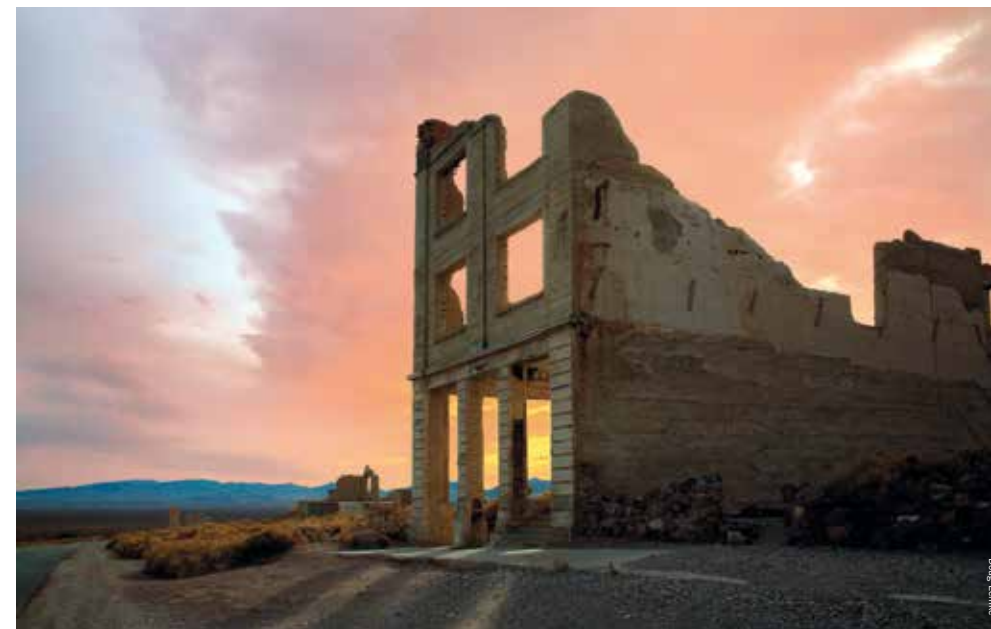
De restanten van de eens imposante Cook Bank in Rhyolite tegen zonsondergang

'Je snapt dat George Lucas op deze plek – die niet van de aarde lijkt – gedraaid heeft voor zijn Star Wars -films'