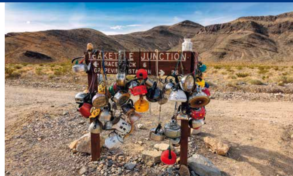
Humor bij Teakettle