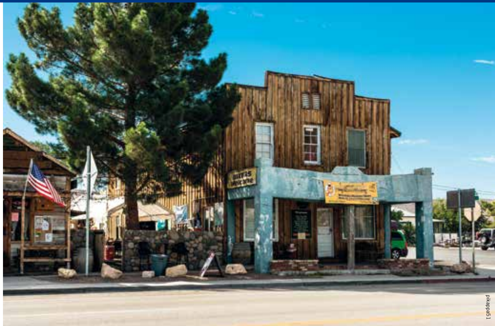
Beatty, een voormalig mijnbouwplaatsje op veertig minuten rijden van het nationale park

Al ligt Death Valley grotendeels in Californië, de dichtstbijzijnde grote stad is Las Vegas, waar vandaan het twee en een half uur rijden naar het park is. Net te doen voor een dagtrip, maar in het veertienduizend vierkante kilometer grote gebied (de helft van België) is zoveel te zien, dat in of nabij het park overnachten is aan te raden. Om de kosten te drukken slapen wij in Beatty, een voormalig mijnbouwplaatsje, wat vervallen, maar vriendelijk, op veertig minuten rijden van het park. Met de dubieuze naam Atomic Inn verwijst ons motel naar de Nevada Nuclear Test Site, waar tussen 1951 en 2008 meer dan negenhonderd kernproeven werden uitgevoerd. De grote paddestoelen die destijds regelmatig boven de woestijn hingen waren in de jaren vijftig van de vorige eeuw een toeristische attractie. Gelukkig