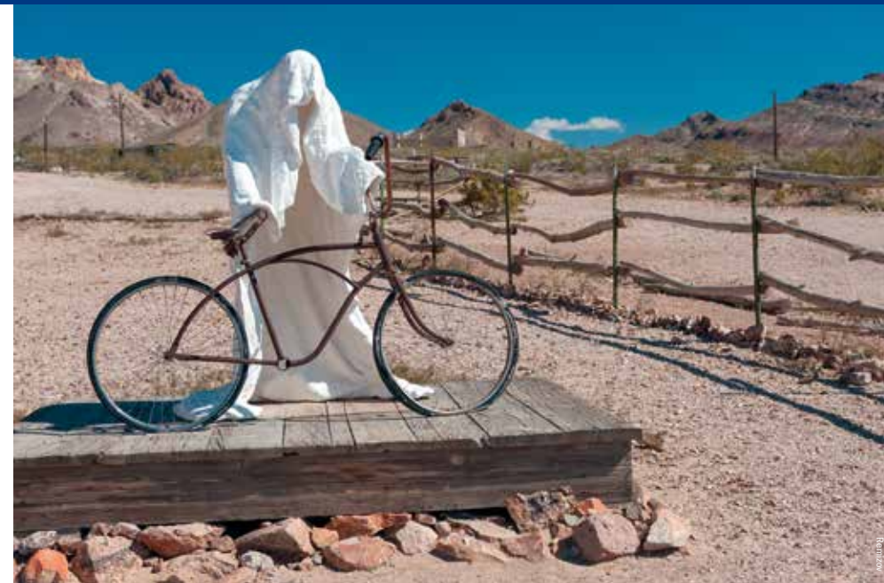
Spookachtige kunst in het spookstadje Rhyolite

De Golden Canyon-wandelroute voert door een goudkleurige canyon met aan weerszijden reusachtige rotsen, soms zacht en rond, dan weer gekarteld van vorm. Honderden miljoenen jaren