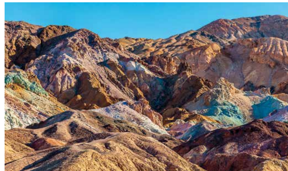
De onwaarschijnlijk mooie kleurschakeringen langs Artist's Drive

enorme vormen aangenomen en doet denken aan geogoste bundels maïs. Satan heeft hier ook een vijver. In een spelonk van 152 meter diep, net buiten het park, leeft een dwergvisje: een tandkarper van een paar centimeter. Dit wonderlijke visje, de Devil's Hole Pupfish, is een beschermde en bedreigde soort die alleen op deze geïsoleerde plek voorkomt en zich thuis voelt in het 33 graden Celsius warme, zoute water.