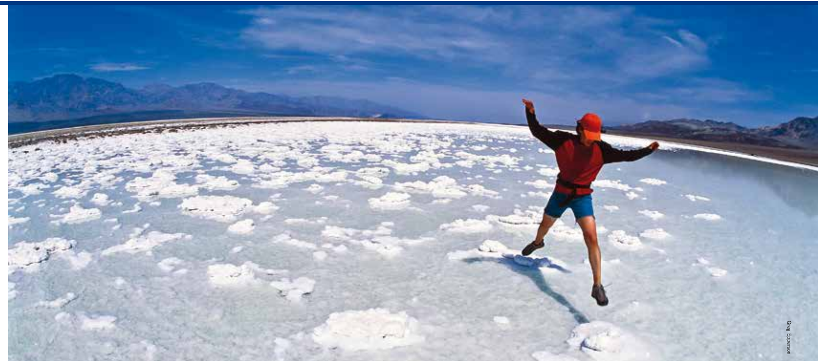
Springen van zouthoop naar zouthoop bij Badwater Basin