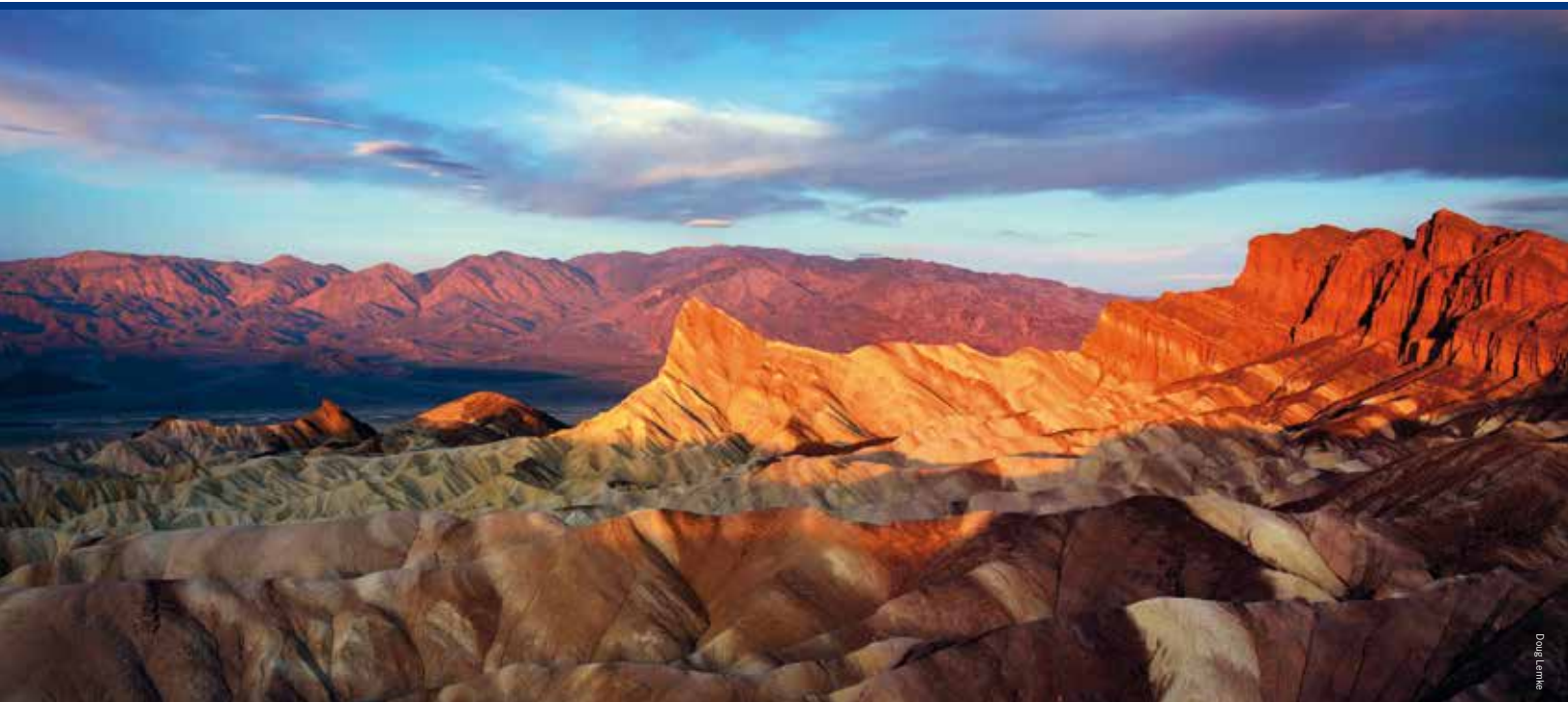
Zabriskie Point in Death Valley National Park

gende bergen met de snelheid en kracht van een goederentrein doorheen kolkt. Een goede reden trouwens om voordat je in een canyon begeeft even de weersverwachting te bekijken. Waar de wandeling pittiger wordt en er geklauterd moet worden over de grote rotsblokken, vind je – weg van mensen – de stilte. Alleen chuckwalla's (grote, plompe hagedissen) baden onbekommerd in het zonlicht dat door de spleten valt.