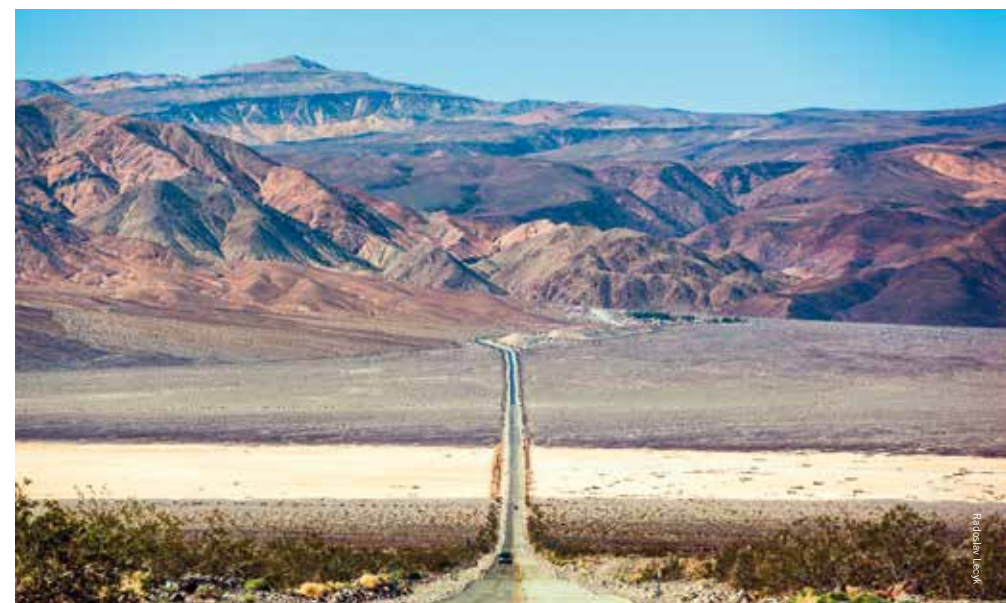
Route 190 is de hoofdweg door het park

In zo'n vreemd, onnaards gebied moet de duivel wel een rol spelen. En ja hoor, deze laatste heeft hier zijn domeinen. De Devil's Golf Course, vlakbij de ijsbaanachtige zoutvlakte van Bad Basin, is een zoutvlakte met een ruig oppervlak. De zoutkristallen zijn hier tot grillige vormen gesmeed door duizenden jaren verwerking. Het terrein is zo oneffen dat het alleen de duivel lukt hier golf te spelen. Wat verderop ligt zijn maïsveld, de Devil's Corn Field. De arrowweed (een inheemse, borstelachtige struik) heeft hier