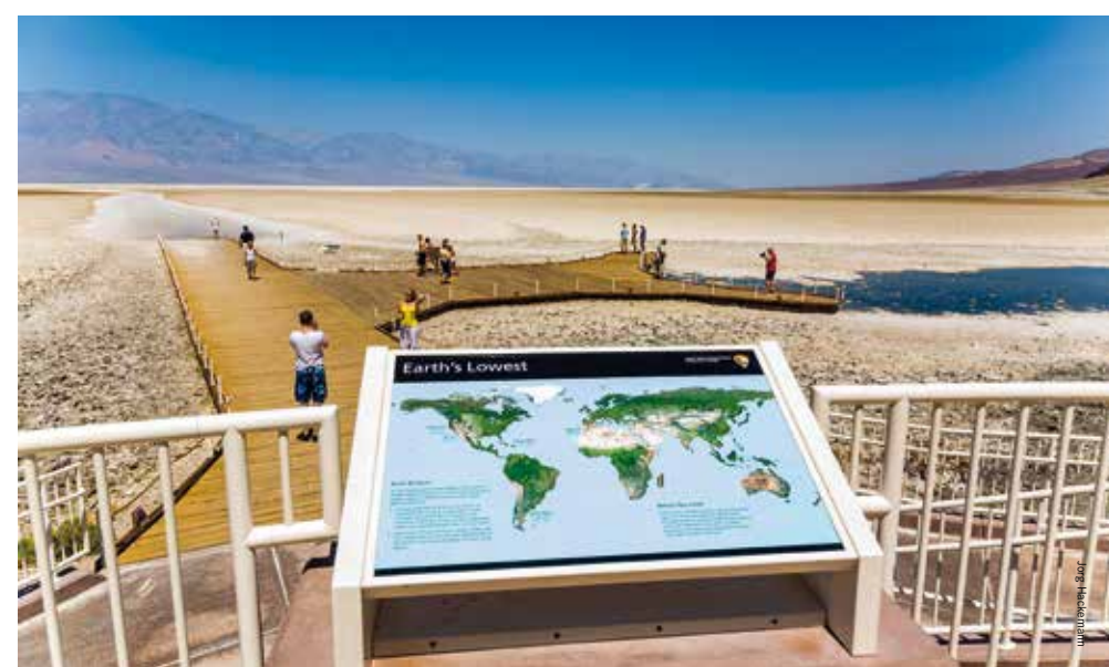
Badwater Basin op 86 meter onder zeeniveau is het laagste punt in Noord-Amerika