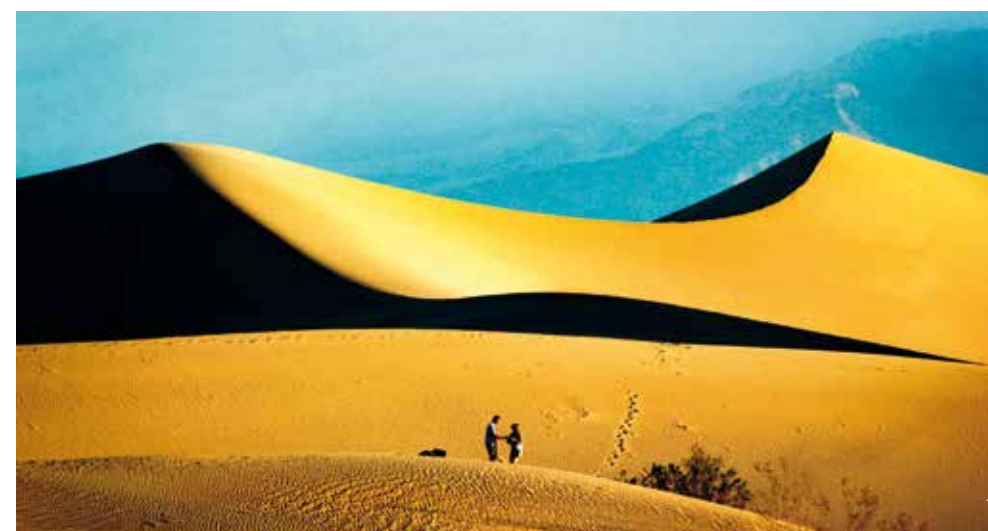
Mesquite flat dunes, Death Valley National Park

'Zijn de canyons al van een majestueuze schoonheid, er zijn plekken in het park die zo bizar zijn dat je aan de echtheid ervan twijfelt'