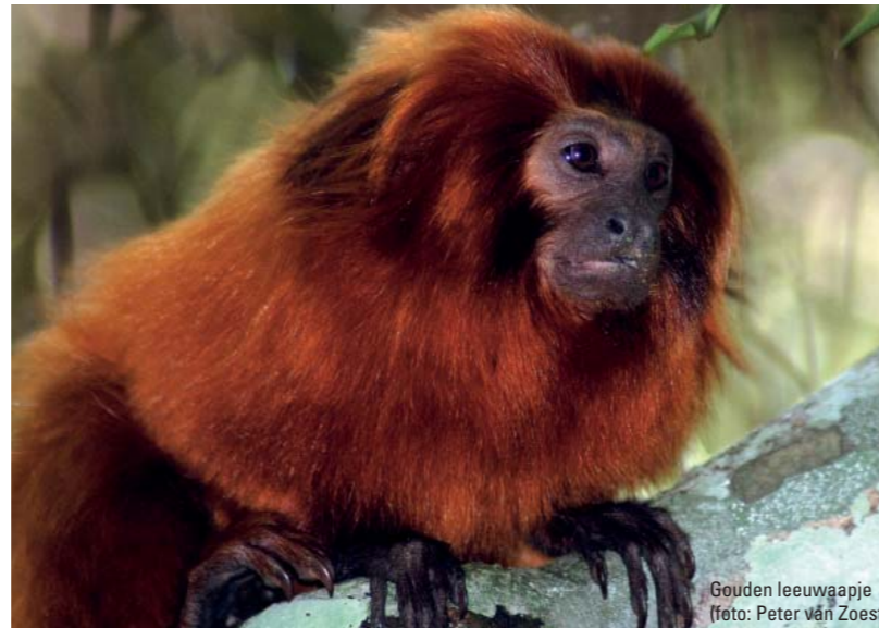
Gouden leeuwaapje